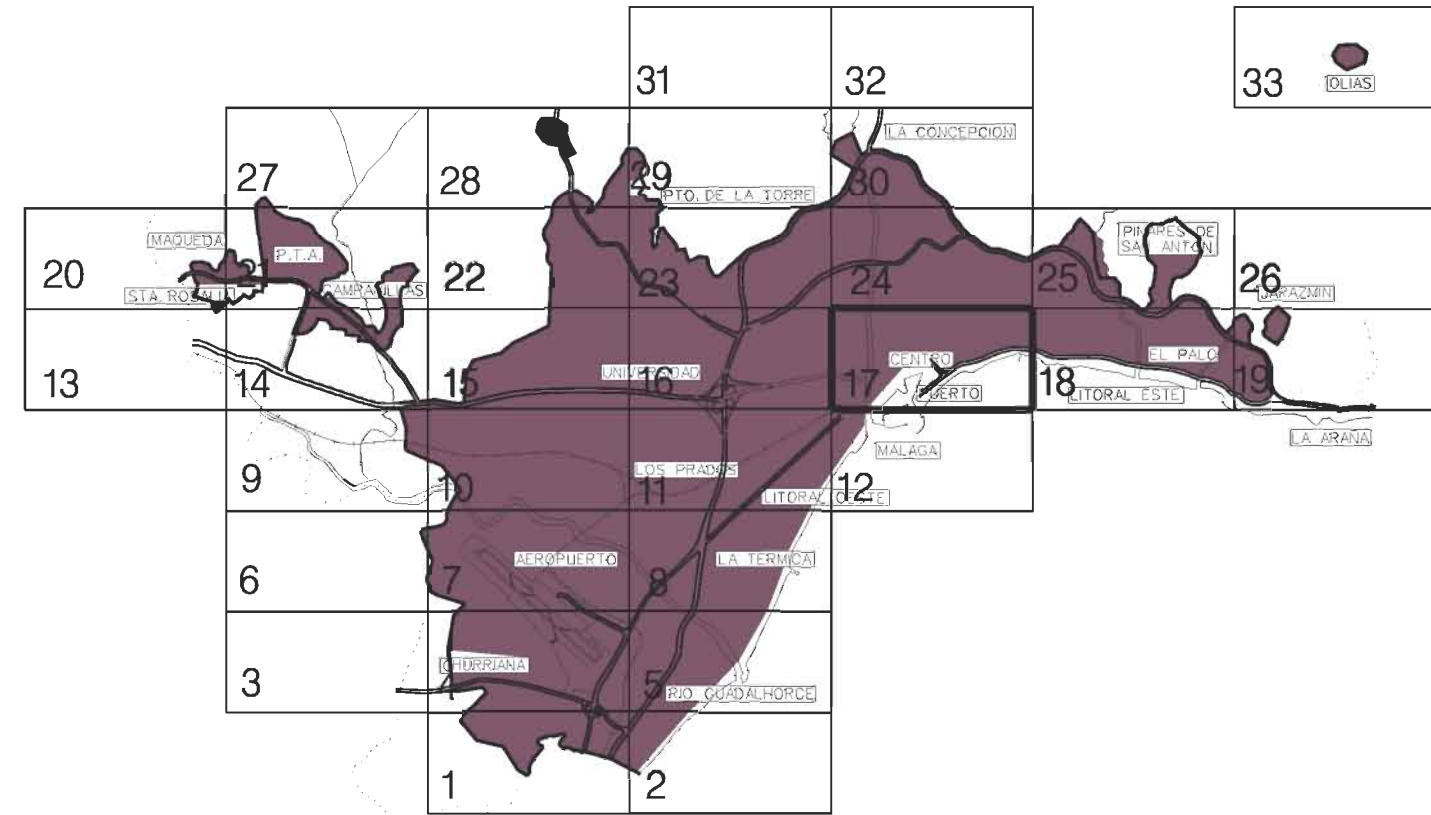
GRAFICO DISTRIBUCION DE HOJAS